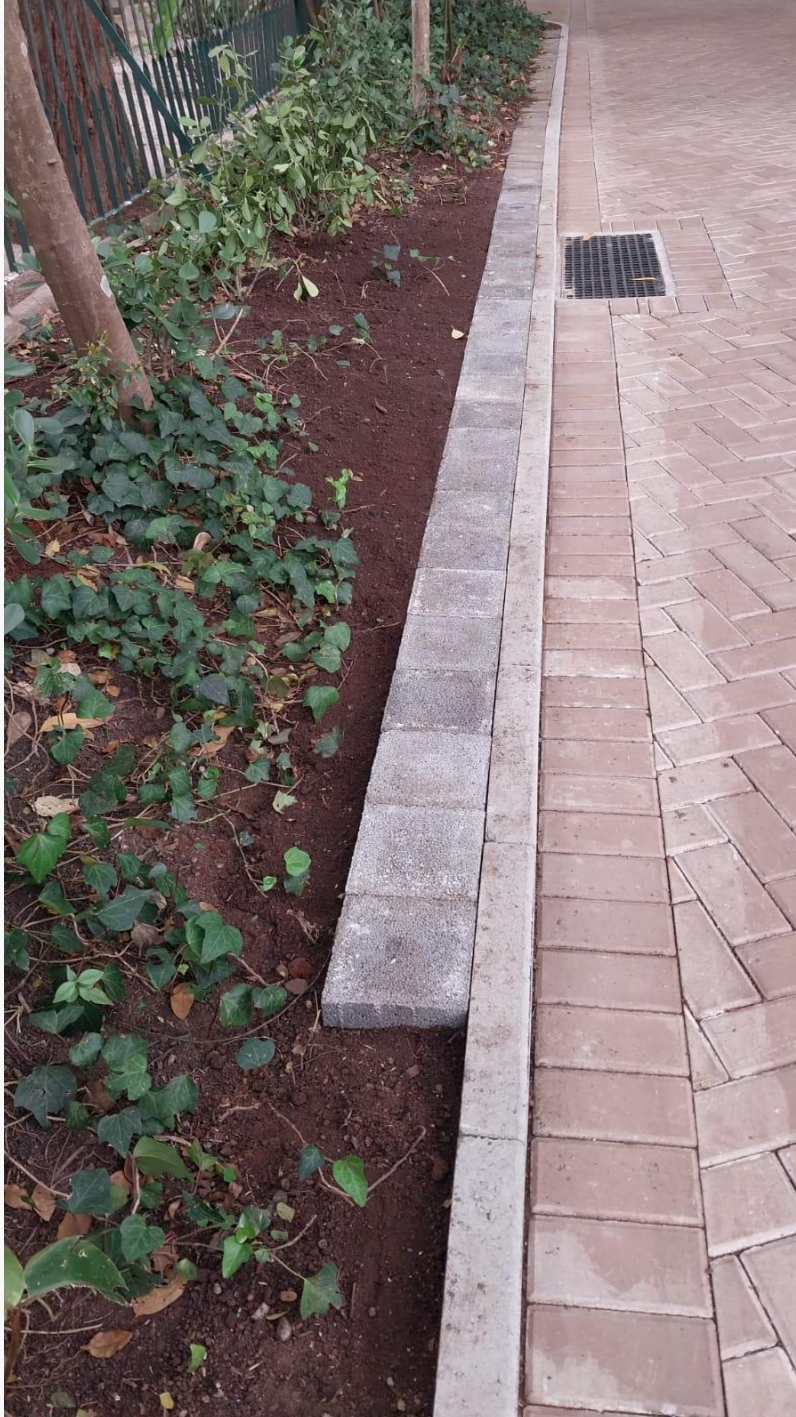
Instalação de caminho de pedra no entorno do parquinho

Relatório de Inspeção SGE - Jardinagem mês de setembro de 2025