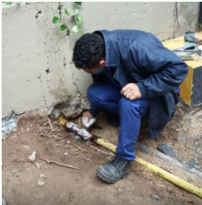
Reparo na tubulação de gás que abastece o prédio do CCR.