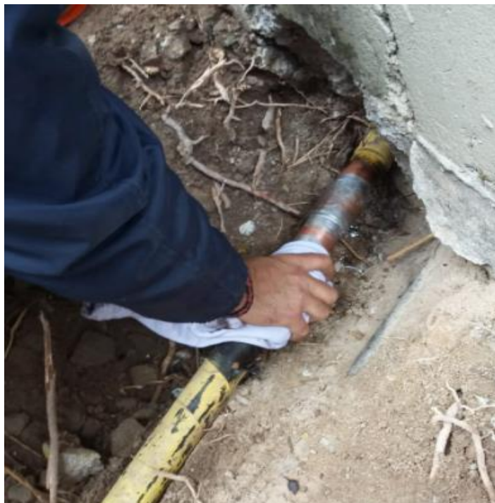
Reparo na tubulação de gás que abastece o prédio do CCR.