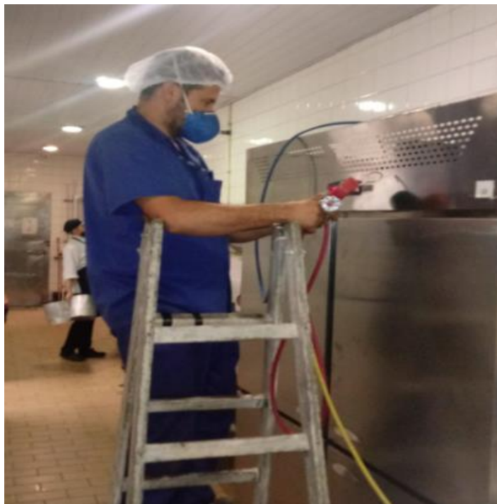
Reparo em uma geladeira vertical no restaurante do CCR.