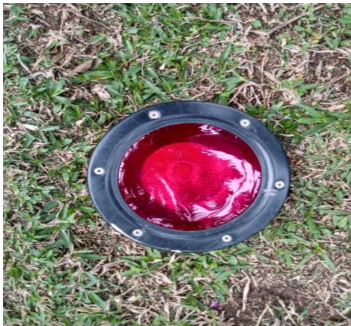
Instalação de gelatina rosa nas luminárias das palmeiras