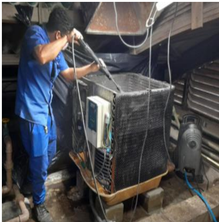
Reparo e manutenção corretiva em uma bomba térmica do aquecimento da piscina da Hidroginástica.