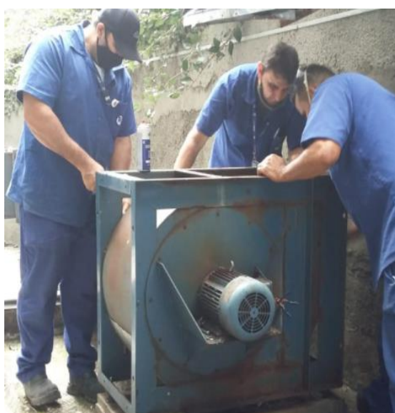
Iniciado a manutenção (troca do exaustor) do sistema de lavagem da coifa do Steak House na Lanchonete da Piscina Externa.