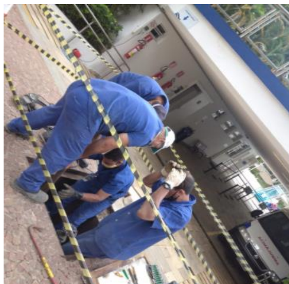
Preparando área e peças para conserto de vazamento no sistema dos hidratantes alameda próximo a emergência médica