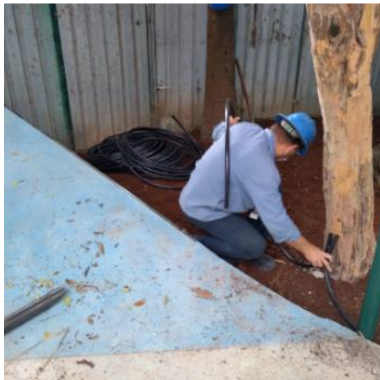
Chegada de rede pública e infraestrutura para circuito de iluminação do jardim